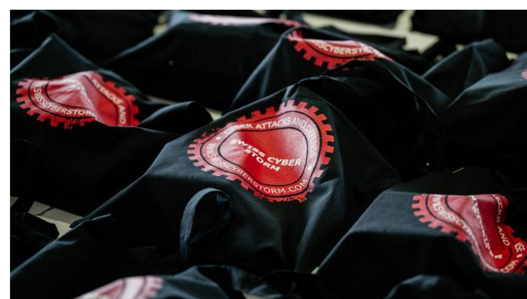
Die Swiss Cyber Storm 2024 findet am 22. Oktober im Berner Kursaal statt.